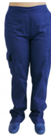
CALÇA SCRUBS SERVIÇOS GERAIS