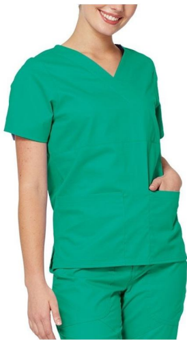
CONJUNTO SCRUBS TECNICOS DE ENFERMAGEM