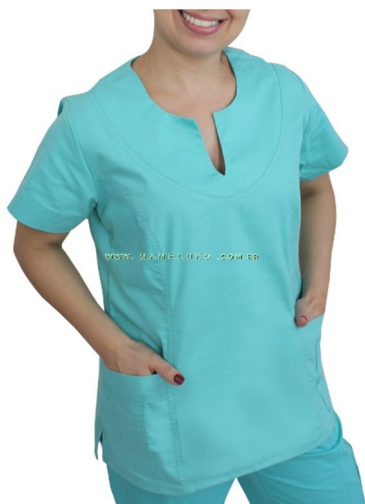
BLUSAS SCRUBS ENFERMEIRAS